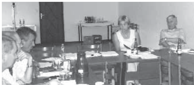
Z výjezdního zasedání představenstva.